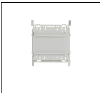
UZB2 Verbindungsset UK600 EAN Art.-Nr. 2CPX031408R9999 Listenpreis 26.10 €