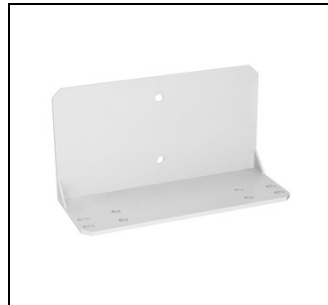
ZX29 Montagetraverse f. ZE225 EAN Art.-Nr. 2CPX061178R9999 Listenpreis 13.55 €