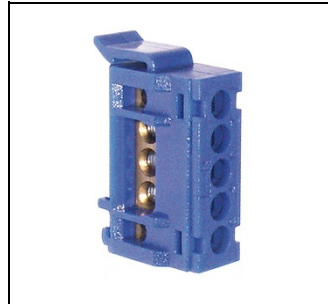
ZK507 FI-Anschluß-Schiene 5x10qmm EAN Art.-Nr. 2CPX030892R9999 Listenpreis 8.70 €