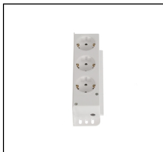
ZE227 3-fach Steckdose EAN Art.-Nr. 2CPX061211R9999 Listenpreis 125.00 €