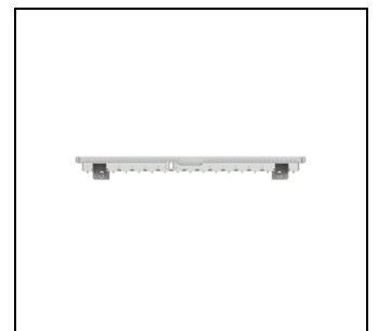
UZB3 Wagrecht Schottung UK EAN Art.-Nr. 2CPX031409R9999 Listenpreis 29.20 €