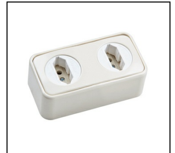
ZE225 Doppel Schuko Steckdose EAN Art.-Nr. 2CPX061177R9999 Listenpreis 50.50 €