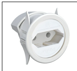
ZE224 Einbausteckdose + EURO ad. EAN Art.-Nr. 2CPX031427R9999 Listenpreis 32.40 €