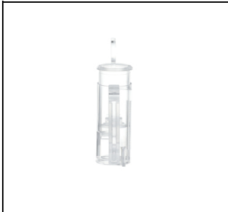
UZ91P4 Hohlwandset zu UK600 EAN Art.-Nr. 2CPX031434R9999 Listenpreis 29.30 €