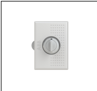
UZT3 Sicherheits-Schloß UK600 EAN Art.-Nr. 2CPX031412R9999 Listenpreis 32.30 €